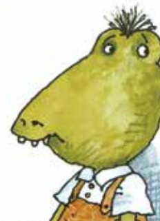
ولی بالاخره آرام می‌شوید

سرانجام ناراحتی‌ها تمام می‌شود و خیلی کارها هست که شما را خوشحال کند.