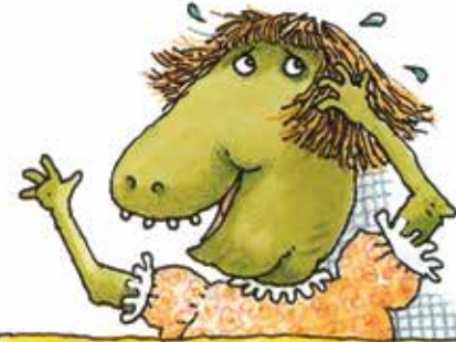
احساس گناه کنید