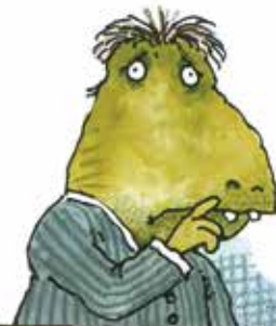
اما نگران آینده‌اید که چه کسی از شما نگهداری خواهد کرد