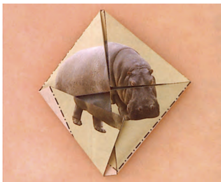
▲ خطوط کمی کج شده‌اند اما خوب تا خورده‌اند.

کودک باید یاد بگیرد که با یک دست کاغذ را محکم نگه دارد و با دست دیگر در امتداد خط مشخص شده تا کند. اگر تا کردنش کمی از خط تعیین شده بیرون بزند، مهم نیست. شما و کودک هنوز هم می‌توانید با کاردستی که درست کردید بازی کنید و سرگرم شوید.