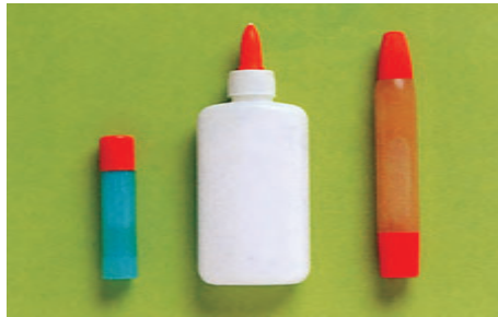
▲ از چسب‌های ایمن برای کودکان استفاده کنید، مثلاً انواعی شبیه تصویر بالا.

پیش از آن‌که کودک کار را شروع کند، میز را با ورقه‌ای کاغذی بپوشانید. از کودک بخواهید مقدار مناسبی از چسب را به شکل لایه‌ای نازک روی کاغذ پخش کند. هنگامی که کودک می‌خواهد پشت برچسب‌ها چسب بزند و آن‌ها را روی کاغذ بچسباند به او یاد بدهید که کاغذ را با یک دست نگه دارد و چسب را با دست دیگر بمالد. چون این کار برای بچه‌های کوچک دشوار است، می‌توانید در ابتدا کاغذ را برای کودک نگه دارید.