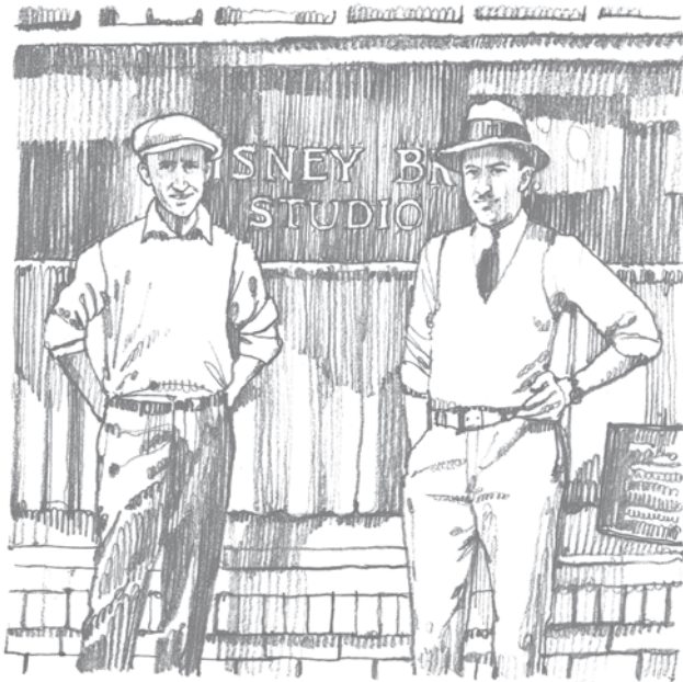
استودیوی برادران دیزنی

می‌کرد. در دوران جنگ جهانی اول، والت راننده آمبولانس صلیب سرخ شد. او این ماشین را با تصویرهای کارتونی تزئین کرده بود. او رؤیای فیلم‌سازی و ساختن فیلم‌های انیمیشن (پویانمایی) را در سر داشت. در سال ۱۹۲۳ به هالیوود رفت و در آن جا، به اتفاق رُی، استودیوی کارتون برادران دیزنی را تأسیس کرد. امروزه باشگاه رسمی طرف‌داران والت دیزنی را D۲۳ می‌نامند. D به نشانه دیزنی و ۲۳ به نشانه سال ۱۹۲۳ که نقطه عطف مهمی در زندگی او بود.